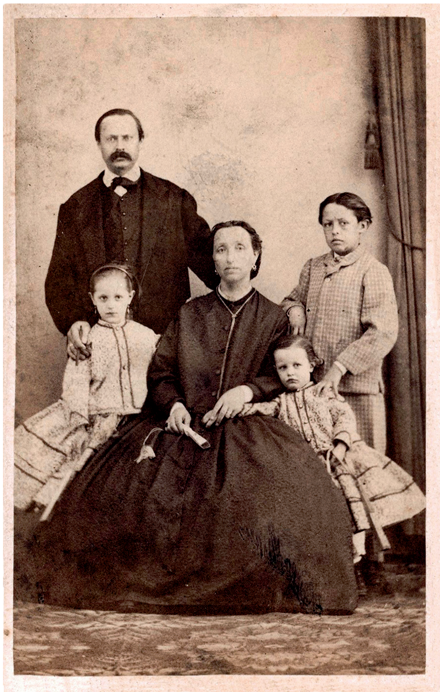
La famiglia Luzzi a Lucca, 1865 ca.