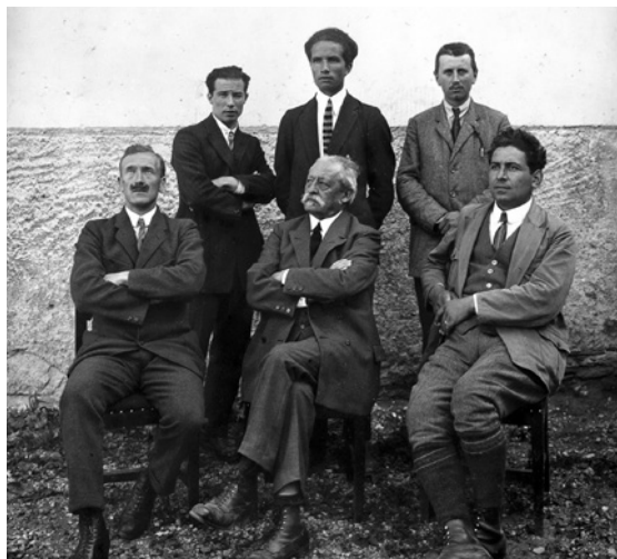
Giovanni Luzzi con i maestri delle scuole elementari riformate, Poschiavo 1928

Nel 1920 la Facoltà valdese di teologia fu trasferita da Firenze a Roma. Quando, nel 1922, fu inaugurata la nuova sede, Giovanni Luzzi, che aveva ormai sessantasette anni, non riuscì a trovarsi a proprio agio nella capitale («troppo grande per me troppo piccino»); 65 aveva nostalgia della città sull'Arno, cercava tranquillità per proseguire la sua opera di traduzione delle Scritture e aveva inoltre l'impressione che il suo lavoro teologico non trovasse più l'eco che egli si aspettava: dopo la crisi della Grande guerra, la sua linea teologica liberale, caratterizzata dalla fiducia nella forza morale dell'uomo e da un atteggiamento di conciliazione con il cattolicesimo, era infatti sempre più criticata, tanto dai colleghi quanto dagli studenti. Dopo soli due anni d'insegnamento a Roma, Luzzi decise così di lasciare l'Italia e tornare nella terra svizzera abbandonata subito dopo la sua nascita: valutò dapprima la possibilità di trasferirsi nel Canton Ticino, ma alla fine approdò in Valposchiavo.