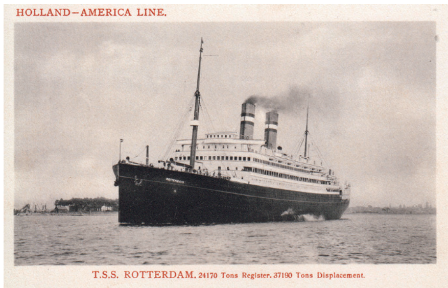
Cartolina del transatlantico «Rotterdam», 1912